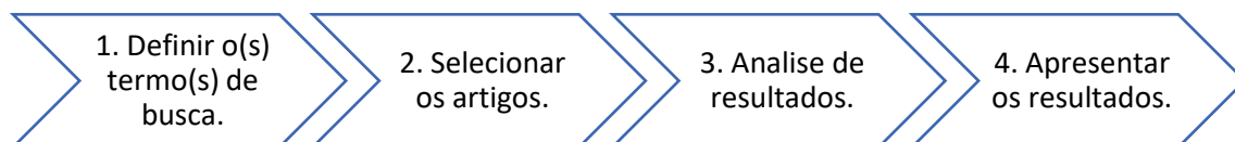
Figura 1 – Procedimentos Metodológicos.

Passo 4: Resultados. Apresentar os resultados da evolução da pesquisa em merchandising e suas técnicas nas compras.